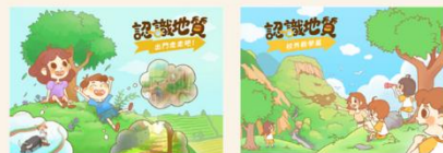
第一本「出門走走吧」 第二本「戶外教學篇」

開發 4 本 AR 繪本「地震來了！」，提供 AR 技術進行地質災害境況模擬技術，享受立體視覺浸淫體驗，以建立學生面對災害時的思維能力與判斷能力，進一步深化防災知識技能。